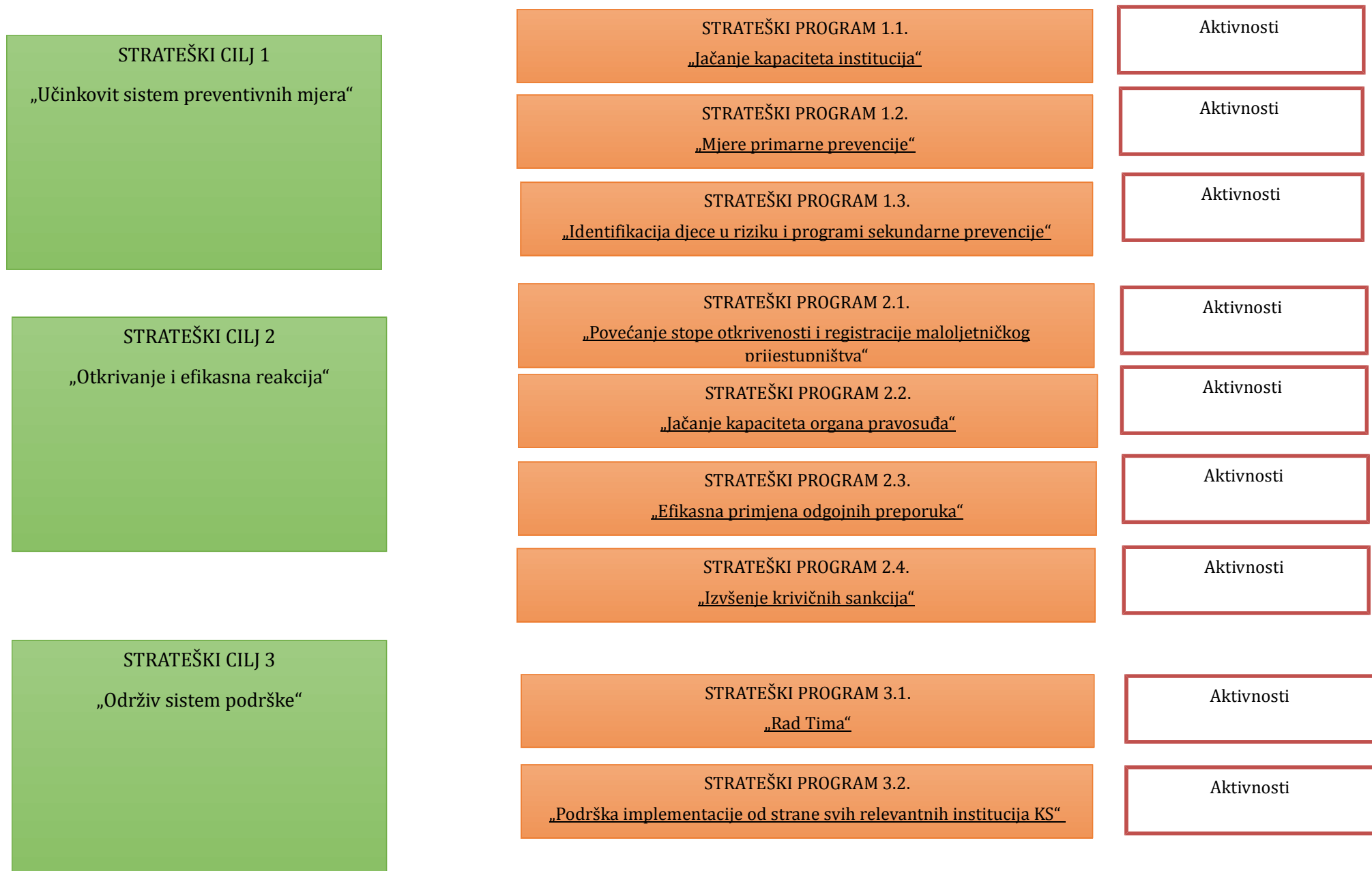
SLIKA 1. STRUKTURA AKCIONOG PLANA